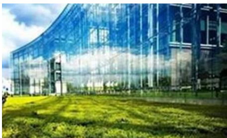
DuMont Haus in Köln-Riehl

Im Rahmen unserer Kölner Einblicke laden wir Sie schon jetzt zu zwei Veranstaltungen ein: