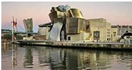
Guggenheim-Museum in Bilbao

Ein Höhepunkt im kommenden Jahr ist unsere Studienreise von Bilbao nach Porto , die vom 29. 05. – 11. 06. 2023 stattfinden wird. Die Anmeldeunterlagen finden Sie als Anlagen zu dieser Mail im PDF-Format oder auf unserer Homepage. Bei Interesse schicken wir Sie Ihnen auch gerne per Post zu. Rufen Sie an oder schicken Sie uns eine Mail oder eine Nachricht über unser Kontaktformular.