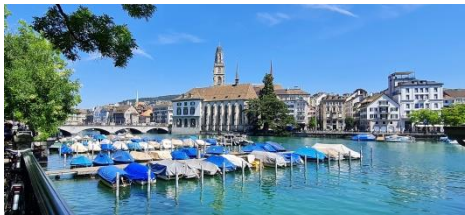
Zürich

Für unsere Kunst- und Musikreise nach Basel und Zürich vom 28. Sept. bis 01. Okt. 2024 stehen noch bis zu 4 Plätze zur Verfügung. Sie erleben zwei historisch gewachsene Kunststädte in herausragender Lage, mit einer großen Vergangenheit und einer wegweisenden Zukunft. In der Fondation Beyler sehen Sie die erste Henri-Matisse-Retrospektive im deutschsprachigen Raum seit fast 20 Jahren. Das Kunstmuseum Basel zählt international zu den renommiertesten Museen seiner Art und umfasst Werke aus acht Jahrhunderten, vom späten Mittelalter bis in die unmittelbare Gegenwart. In Zürich können Sie u. a. eine Gegenüberstellung der Werke des kanadische Malers und Zeichners Matthew Wong (1984 Toronto – 2019 Edmonton) und seinem Vorbild Vincent van Gogh (1853 Zundert – 1890 Auvers-sur-Oise) bestaunen. Beide Maler sind bekannt für ihre Landschaften von expressiv-lyrischer Kraft.